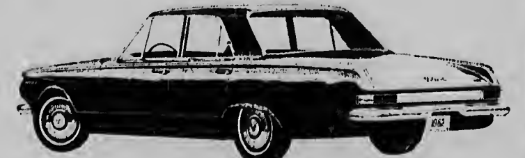
1963 VALIANT - V200